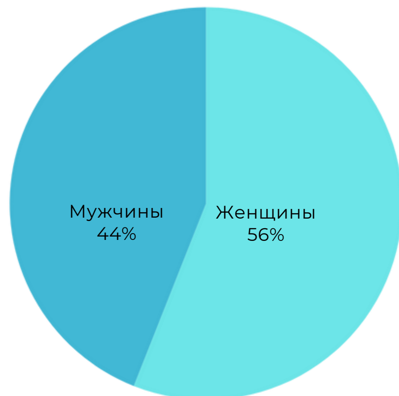
Гендерный состав холдинга "ИНТЕГРАЛ"