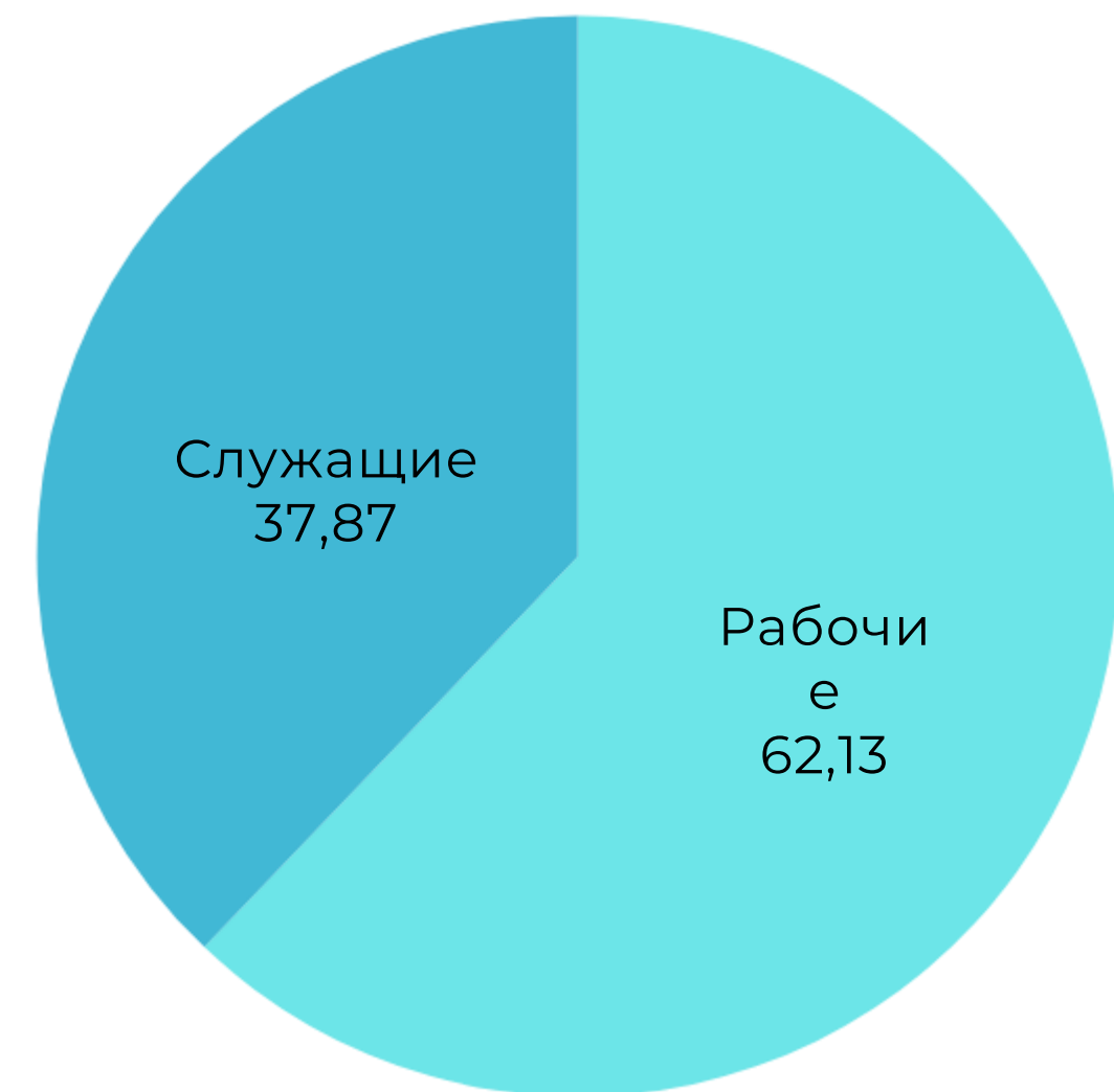
Профессиональный состав персонала