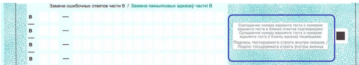
Рис. 5. Поле для подписи

! Сверьте соответствие номера варианта в бланке ответов и педагогическом тесте. Если варианты совпадают, то поставьте подпись в окошке в правом нижнем углу бланка, если нет, то поднимите руку. • [Покажите на демонстрационном бланке ответов поле для подписи (рис. 5).]