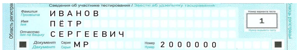
Рис. 2. Образец заполнения области регистрации

Если при заполнении области регистрации бланка ответов допущена ошибка, неверную информацию следует зачеркнуть, а правильные данные записать в том же поле справа, отступив на одну клетку.