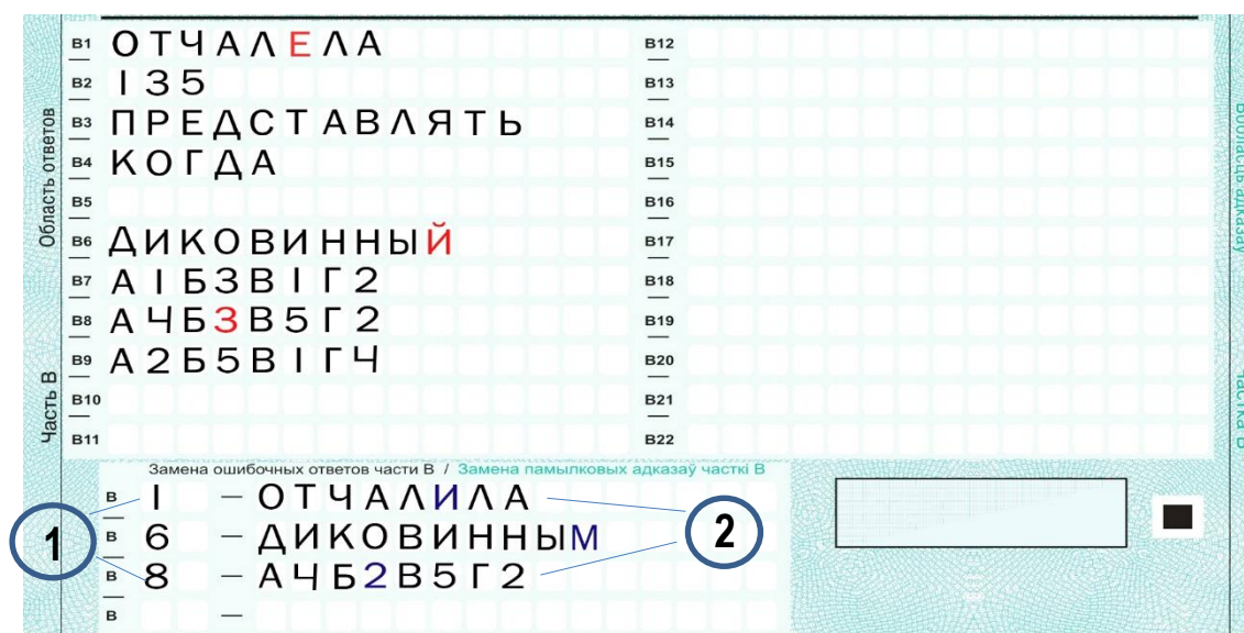
Рис. 4. Область замены ошибочных меток в части В

При проведении централизованного экзамена по иностранным языкам ответственный педагогический работник обязан сообщить участникам ЦЭ, что образцы написания латинских букв находятся в самой экзаменационной работе перед частью В.